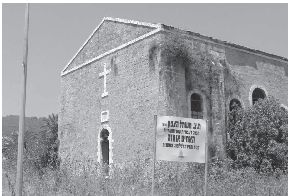
Aujourd'hui, l'église dans le village natal de Youssef Sayegh, al-Bassa.

Youssef Sayegh (1916–2014), ex-directeur de l'Institut de recherche économique et ex-président du département d'économie de l'Université américaine de Beyrouth (AUB), était reconnu dans la communauté scientifique comme expert du développement économique arabe. Il était également connu pour le travail qu'il avait accompli auprès de l'OLP dans la préparation stratégique de la résistance et du développement économique, notamment la création de l'Agence palestinienne pour le développement économique et la reconstruction (PEDRA, devenu ensuite PECDAR). C'est Rosemary Sayegh 1 , anthropologue et compagne de Youssef pendant plus de cinq décennies, qui a compilé et édité ces mémoires, faisant preuve de la même compassion pour le quotidien et les gens qui caractérise son travail d'histoire orale. Ces mémoires vont