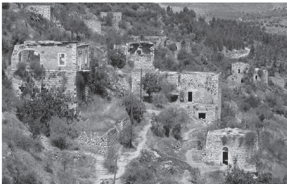
Destruction de l'héritage culturel: Lifta près de Jérusalem, laissé à l'abandon.

L'appel au boycott culturel échauffe les esprits. En tant que stratégie politique, il est entièrement justifié. Afin de gagner les acteurs culturels locaux à se solidariser avec l'appel palestinien, un certain travail de persuasion est toutefois encore nécessaire.