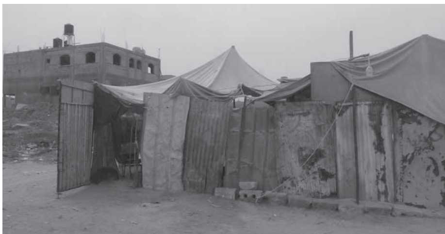
Beit Hanoun, été 2015.

Dans un rapport 1 récent, le bureau de coordination des affaires humanitaires (OCHA) recense plus de 75 000 déplacés internes à Gaza. Lors de la dernière attaque israélienne en 2014, plus de 16 000 foyers ont perdu leur maison. Nombre d'infrastructures publiques telles que des écoles, des hôpitaux, des installations sanitaires ou énergétiques ont été sévèrement endommagées. Les déplacés vivent dans des conditions précaires, un quart vivant dans les restes de leurs maisons. Selon OCHA, sur un peu plus de 1,8 million d'habitants à Gaza, plus de 1,3 million ont aujourd'hui besoin d'assistance humanitaire. Tandis qu'Israël n'a pas eu à répondre de ses actes et de ses violations du droit international, un rapport récent de WHO profits 2 met en lumière le profit que tire le marché de la construction israélien des destructions causées par l'État israélien.