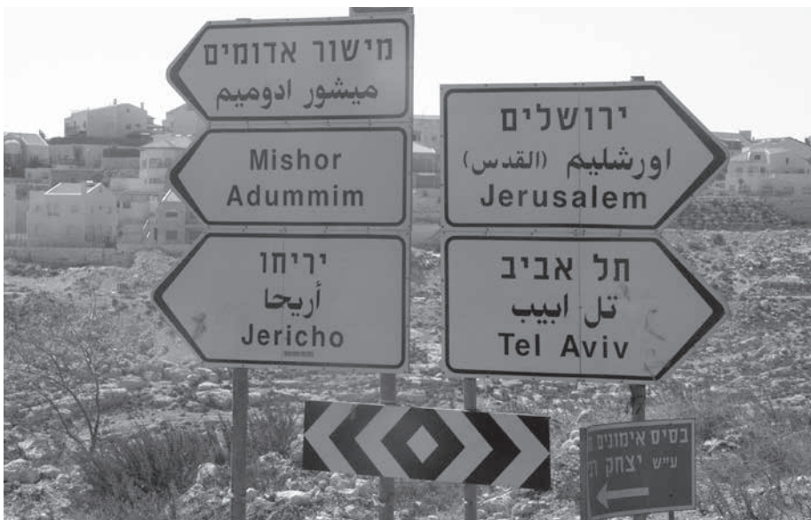
Panneau de signalisation près de la zone industrielle de Mishor Adumim.

La nouvelle directive européenne pour l'étiquetage des produits issus des colonies ne suffit pas aux exigences du droit international. L'effacement par Israël de la Ligne verte n'est pas non plus pris en compte.