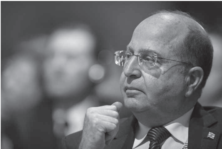
Moshe Ya'alon, un homme sollicité.

Dans plusieurs pays, le Ministre israélien de la défense qui vient de se retirer, fait l'objet d'un mandat d'arrêt. En Suisse il a été reçu à bras ouverts en tant que détenteur de réponses actuelles aux « questions de sécurité internationale ».