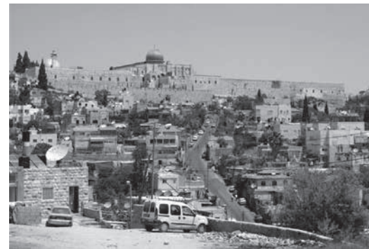
Wadi Hilweh, avec la mosquée al-Aqsa.

Tout cela ne présage rien de bon pour les Palestiniens de Silwan. Leur cadre de vie est modifié sans qu'ils ne soient même consultés. Au prétext-