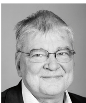
Daniel Vischer Nationalrat (Grüne) Zürich