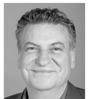
Joseph Zisyadis Conseiller national - 2011, Parti du travail, Lausanne