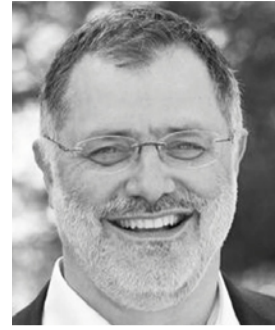
Carlo Sommaruga Avocat, Conseiller national Genève