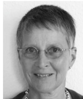
Marianne Ebel Députée Grand Conseil Neuchâtel