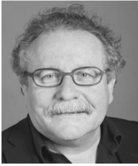
André Daguet Nationalrat bis 2011 (SP), Gewerkschafter, Bern