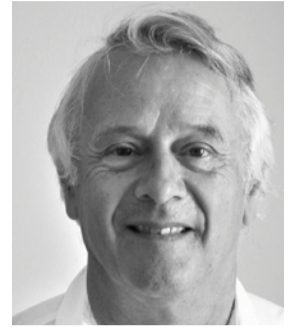
Marc Brunn Architecte Genève