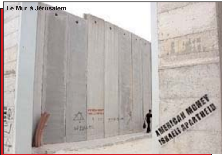
Le Mur à Jérusalem

Jérusalem est un centre d'activités culturelles, religieuses et commerciales depuis des milliers d'années. La ville reflète la diversité des cultures, une riche diversité ethnique et joue le rôle de lieu majeur pour les trois religions monothéistes . Marocains, Africains, Syriens et d'autres faisaient des pèlerinages jusqu'à la ville. Ce fut un centre pour les marchands et un point de rencontre entre l'est, l'ouest, le nord et le sud. Des institutions et entreprises religieuses, sociales et éducatives y ont prospéré. La ville a pris de l'ampleur à travers les siècles.