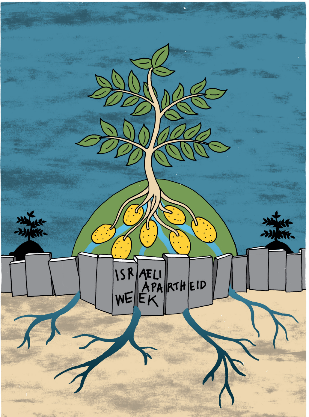
Internationale Woche gegen die israelische Apartheid 2016